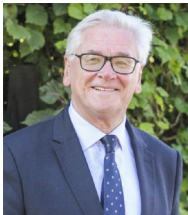
Jean-Claude LEROY , Président du Conseil Départemental du Pas-de-Calais

Déjà 50 éditions que l'Enduropale du Touquet Pas-de-Calais prend place sur les plages du Touquet-Paris-Plage et de Stella-Plage.