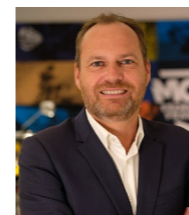
Sébastien Poirier , Président de la Fédération Française de Motocyclisme

L'Enduropale du Touquet-Pas-de-Calais s'apprête à célébrer sa 50ème édition, marquant un demi-siècle d'histoire pour l'une des épreuves les plus mythiques du motocyclisme mondial. Fidèle à son ADN, cette épreuve unique témoigne des valeurs de courage, d'engagement et de dépassement de soi qui font la richesse de notre discipline.