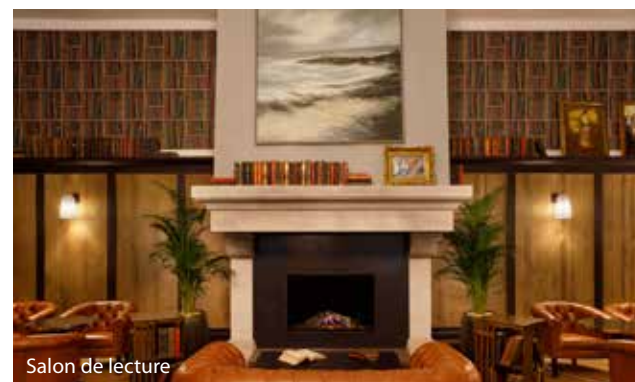
Salon de lecture