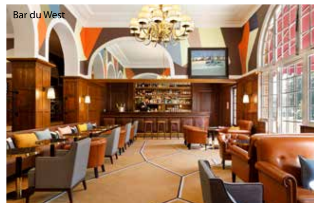
Bar du West