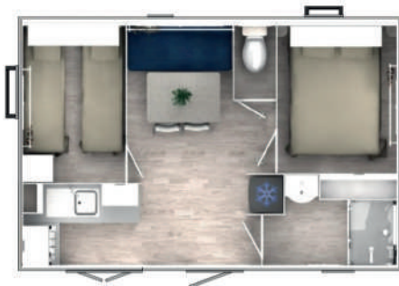
Evolution 24 n°84