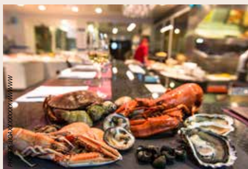
Sur place ou à emporter, ici les produits de la mer sont rois